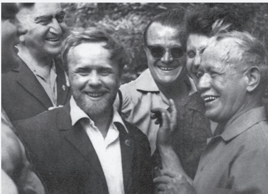
В. Белов и М. Шолохов в Вешенской