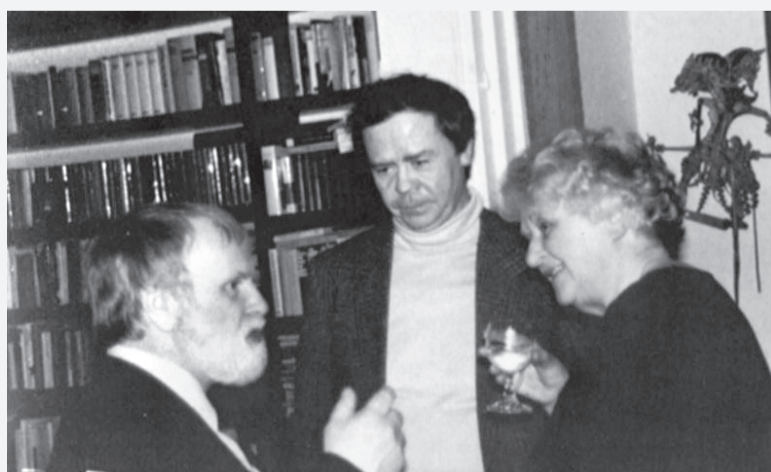
В. Белов и лауреат Государственной премии В. Распутин