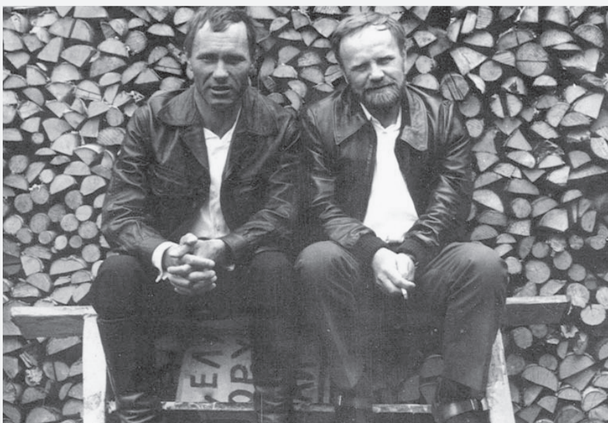
В. Белов и В. Шукшин на съемках кинофильма «Калина красная»