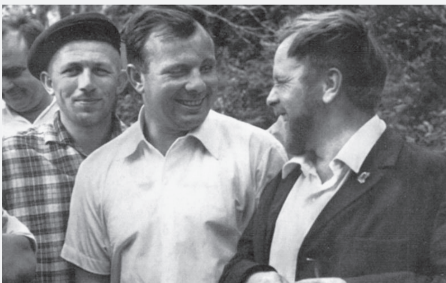
В. Белов и первый космонавт земли Ю. А. Гагарин